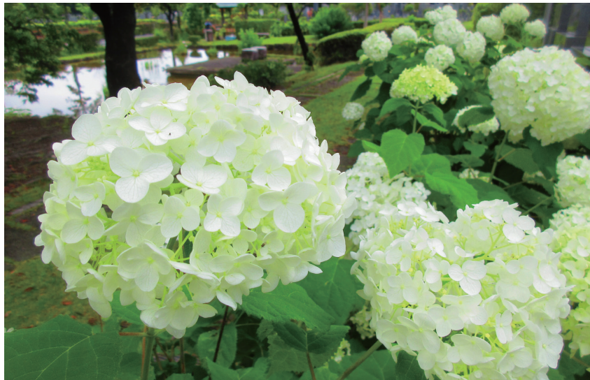
見頃を迎えたアジサイアナベル

墓地と公園の2つの機能を併せ持つ「みどりが丘公園」。お墓参りはもちろんのこと、散歩やジョギング、自然観察にも人気のスポットです。四季折々に美しい景色を眺めながら、ゆったり心なごむ時間をお過ごしください。