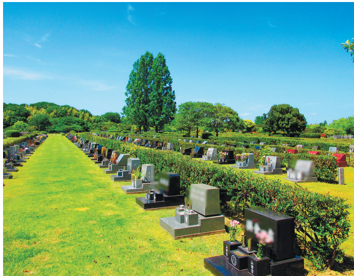
一般墓地(芝生墓地)

令和8年度一般墓地(普通墓地・芝生墓地・修景墓地)の使用者を募集します。受付初日の4月19日(日)は、名古屋市内にお住まいの方を対象に、抽選会を開催します。翌日4月20日(月)から翌年3月6日(土)までの募集期間は、名古屋市以外にお住まいの方も申込可能で、随時申込受付いたします。詳細は、当園事務所や区役所等に配架中の募集案内をご確認ください。