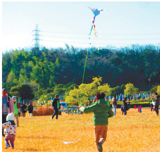
手作り凧あげ教室

一般墓地（普通墓地・芝生墓地）と合葬式墓地（共同埋蔵墓・個別埋蔵墓）の使用者募集は随時受付中です。詳細については当園事務所や各区役所等に配架中の募集案内、当公園のホームページ（で）確認ください。