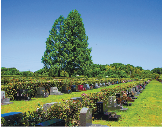
一般墓地(芝生墓地)

令和7年度一般墓地(普通墓地・芝生墓地)の使用者を募集します。受付初日の4月20日(日)は、名古屋市内にお住まいの方を対象に、抽選会を開催します。翌日4月21日(月)から翌年3月6日(金)までの募集期間は、名古屋市以外にお住まいの方も申込可能です。随時申込受付いたします。詳細は、当園事務所や区役所等に配架中の募集案内書をご覧ください。