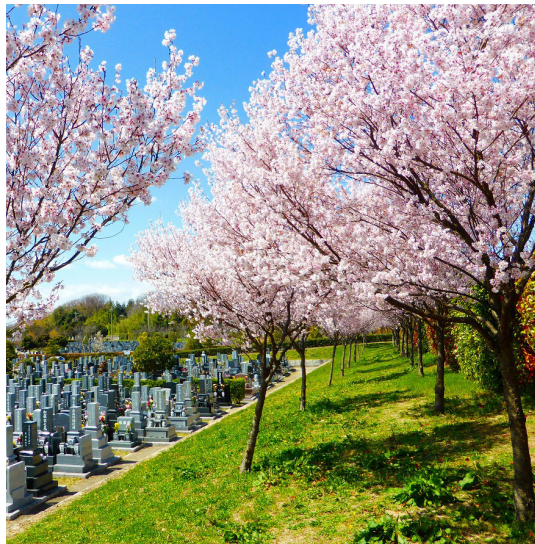
見ごろを迎えたコヒガンザクラ

墓地と公園の2つの機能を併せ持つ「みどりが丘公園」。お墓参りはもちろんのこと、散歩やジョギング、自然観察にも人気のスポットです。四季折々に美しい景色を眺めながら、ゆったり心なごむ時間をお過ごしください。