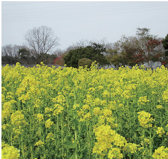
園内を彩るナノハナ

名古屋市内にお住まいの方を含めて、一般墓地と、合葬式墓地の使用者を随時受付中です。