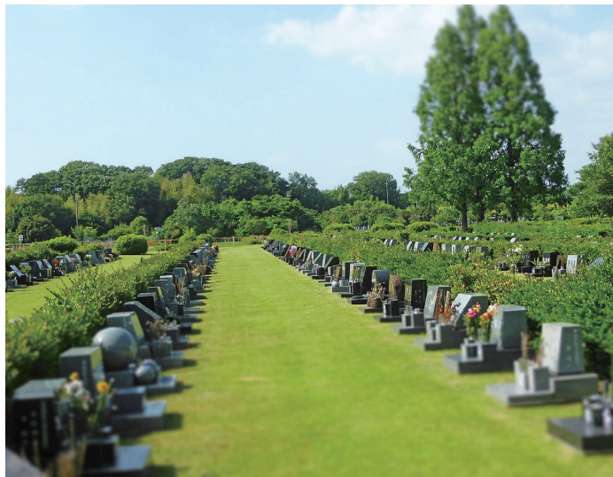
一般墓地(芝生墓地)

お墓を継ぐ人がいない方や、子供にお墓の管理等の負担をかけたくない方、終活等で生前に申込みたい方などに適しています。募集期間は5月10日(金)から翌年3月6日(木)まで、名古屋市在住で焼骨を含む申込の方、名古屋市在住で生前申込の方、名古屋市外在住の方、それぞれ受付開始日が異なりますのでご注意ください。詳細は当園事務所や区役所等に配架中の合葬式墓地募集案内書をご覧ください。