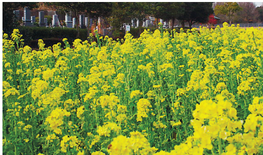
園内を彩るナノハナ

● 春のイベントをいち早くお知らせ みどりが丘公園会館では、藤田医科大学と共催する「春の健康教室」など様々なイベントを開催します。詳細は左のお知らせをご覧ください。