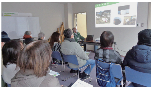
昨年の開催の様子