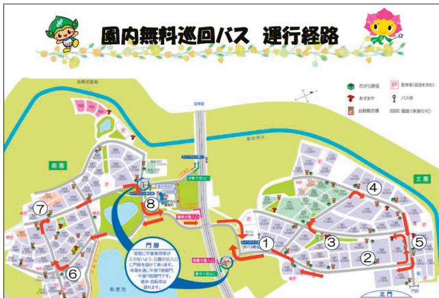
園内無料巡回バス 運行経路

同時開催する「竹細工ミニ教室」では、竹細工展の中から竹の道具（竹箸等）、竹の遊具（竹けん玉等）をご希望に応じて体験できます。詳細は左のお知らせをご覧ください。