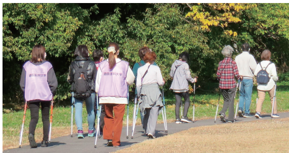
ポールではじめてのウォーキング