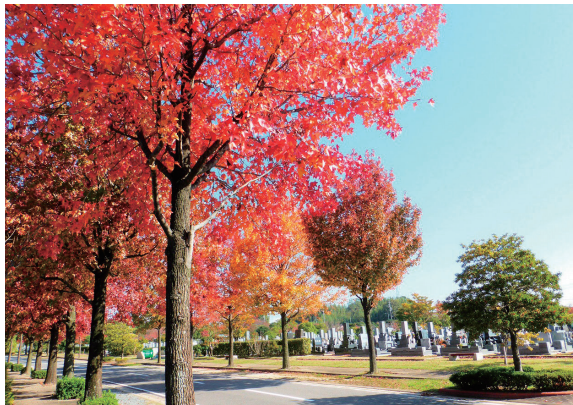
紅葉のアメリカカフウ並木

展示会は自然豊かなみどりが丘公園とその周辺の野鳥を撮影した「野鳥写真展 みどりが丘公園の周辺の野鳥(夏秋編)」をみどりが丘公園会館にて開催中です。11月の催事等の詳細は左のお知らせをご覧ください。