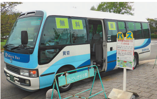
園内無料巡回バス

今年、4組が共演するコンサートにリニューアルした「夕暮れコンサート」を8月13日(日)に開催します。また、8月11日(金・祝)~15日(火)には、広いみどりが丘公園内で手を上げれば自由に乗り降りができる無料巡回バスを運行します。是非ご利用ください。お盆期間中の8月11日(金・祝)~13日(日)には、会館と北園に臨時売店を開設し、供花、ローソク、線香などの墓参用品の他、果物等も販売いたします(北園は墓参用品のみの販売となります)。