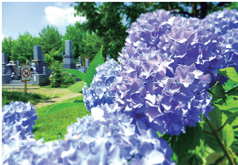
墓地を彩るアジサイ

はじめじめとした雨が長く続く梅雨の季節となりました。お墓参りに来られる方は濡れた地面で滑らないように、足元にお気を付けながらご来園ください。みどりが丘公園では、アジサイ、クチナシなどの初夏の花々が見ごろを迎えます。園内を散